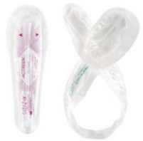
Einmalkatheter für Frauen und Männer

Actreen® EINE GUTE WAHL FÜR SIE UND DIE UMWELT