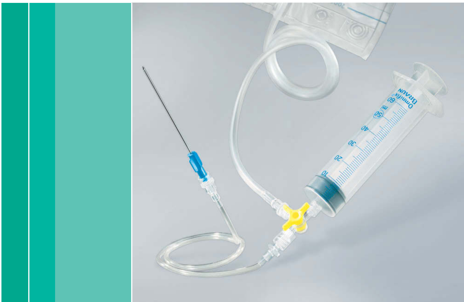
Pleura Drainage Systeme