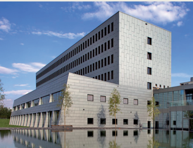
B. Braun Ausbildungszentrum

Weitere ausführliche Informationen unter www.bbraun.de